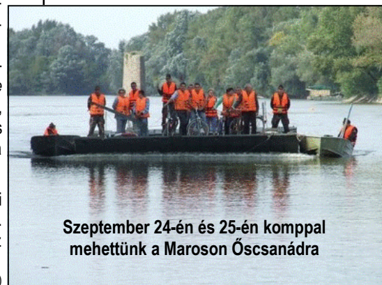
Szeptember 24-én és 25-én komppal mehettünk a Maroson Ócsanádra

Szeptemberi hónapban szép, új könyvek beszerzésére került sor a könyvtárba, remélhetőleg mindenki megtalálja az őt érdeklő műveket.