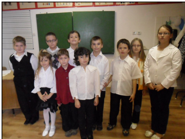
A fotó a magyarcsanádi versenyen készült