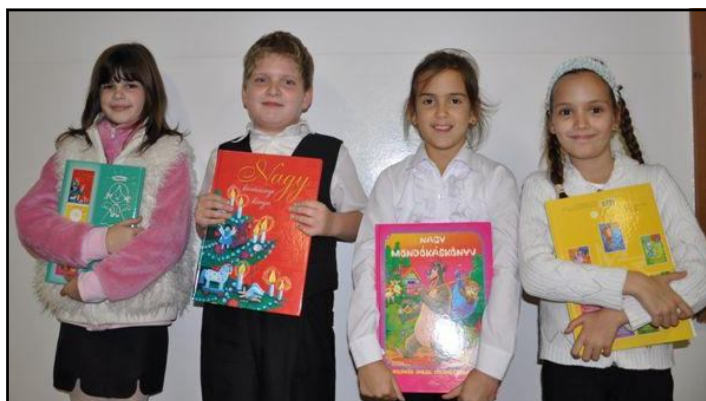
A fotó a makói versenyen készült